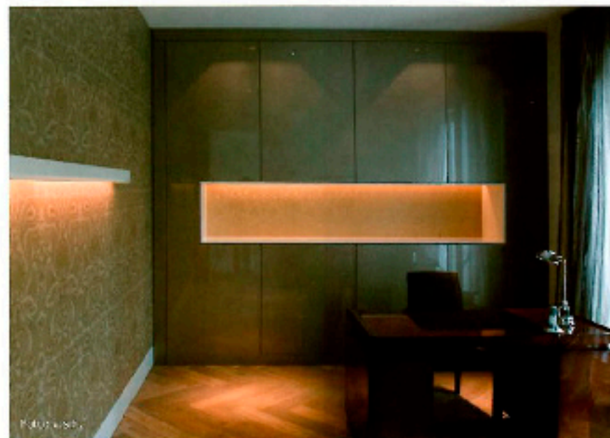
Konzeptionell eingebunden: ein Art-deco-Schreibtischmöbel in Harmonie mit modernen Hochglanzmaterialien

Wenn ich ein altes Möbel mit starkem Charakter habe, setze ich dieses bewusst in Szene und unterstreiche seine Besonderheit und Einzigartigkeit durch ein kontrastierendes Umfeld. Das erzeugt Spannung, Reibung und Wärme. Man sollte nichts