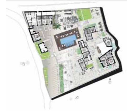
LYO BOUTIQUE HOTEL

Στην περιοχή Πυργί της Μυκόνου πάνω από την όμορφη παραλία του Super Paradise, το άλλοτε εκκλησιάκι της Αγίας Μαρίνας, με τα κελιά που χρησίμευαν για τη φιλοξενία των πιστών, μετατράπηκε σε ένα υπερπολυτελές ξενοδοχείο με πανοραμική θέα προς τη θάλασσα.